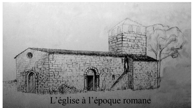
L'église à l'époque romane

Elle fut construite postérieurement à une petite chapelle chrétienne, érigée sur le coteau pour contrecarrer un culte païen et dédiée à Saint Eusèbe. Pour mémoire, Saint Eusèbe (286-370), évêque de Verceil en Ligurie, combattit l'hérésie arienne ; il était invoqué contre les possessions diaboliques et les incendies. Son nom fut attribué à notre principal coteau puis, en 1920, à notre commune pour la différencier d'une autre commune française du même nom.