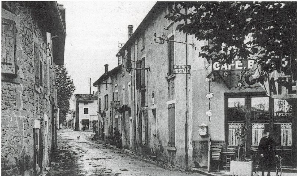
La rue principale après 1925. C'est en quelque sorte la rue commerçante du village ; à l'angle le café Thon, puis l'agence postale et le bureau de tabac Ancelin.