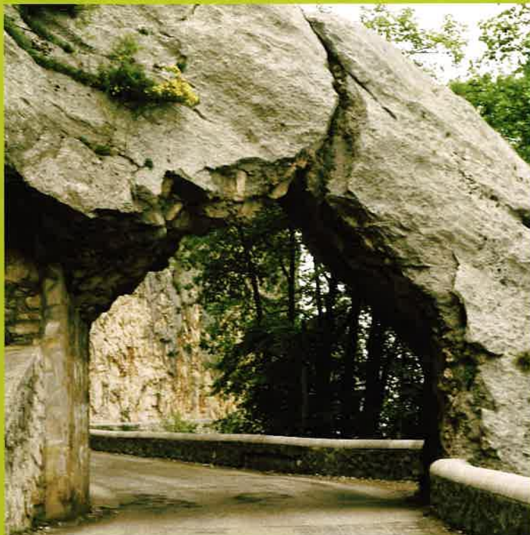
Vercors - Combe Laval

Sous les rubriques du Petit Moursois, sont évoquées des questions d'actualité et des questions de fond qui concernent la vie des habitants de notre collectivité : parmi les questions d'actualité récentes ou à venir, la compétition nationale de BMX et l'élection du parlement européen ; à ce sujet, au niveau moursois, lumière sur le taux de participation supérieur aux taux départemental et national mais regret qu'individualisme, consumérisme... provoquent chez un certain nombre d'électrices et d'électeurs l'abstention ou une attirance, par perte de mémoire... pour certaines idéologies populistes et extrémistes qui se proposent de penser pour vous, avec un discours alléchant qui vous dispense de faire appel à votre esprit critique et à l'effort de vous informer et de vous former pour vous comporter en citoyennes et citoyens responsables et actifs.